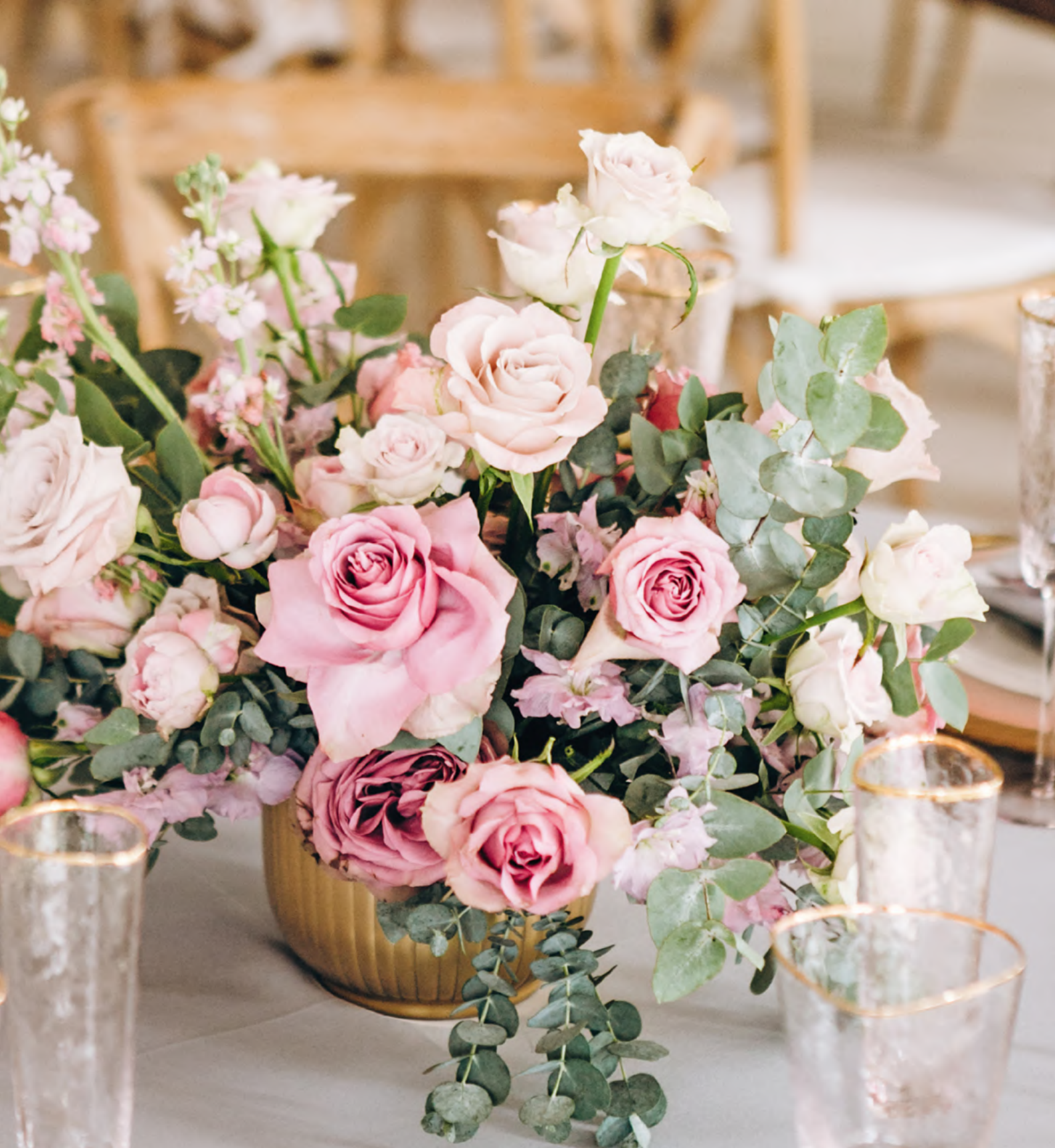
TABLE DES MARIÉS